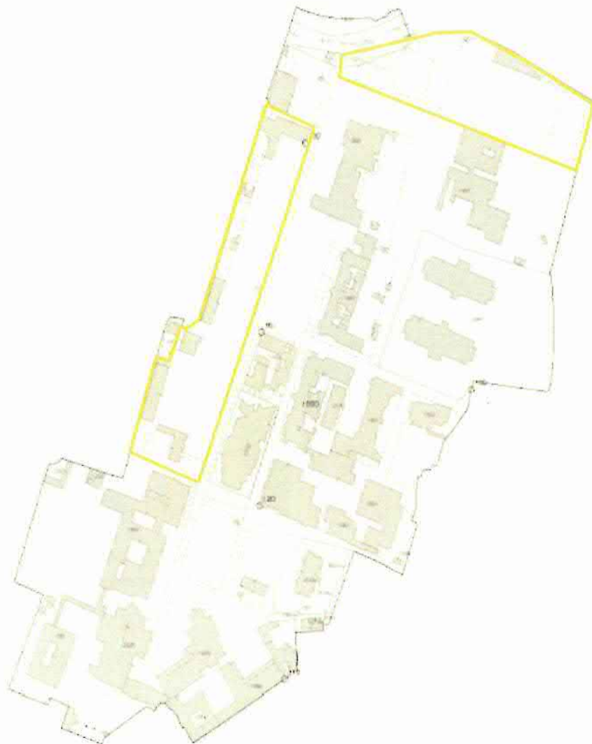
Figura 1.1: Comune di Bisceglie – Estratto Planimetria Catastale