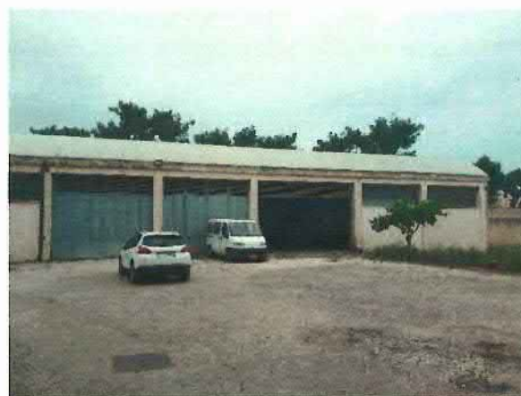
Lotto 2 – Alcuni fabbricati non strumentali