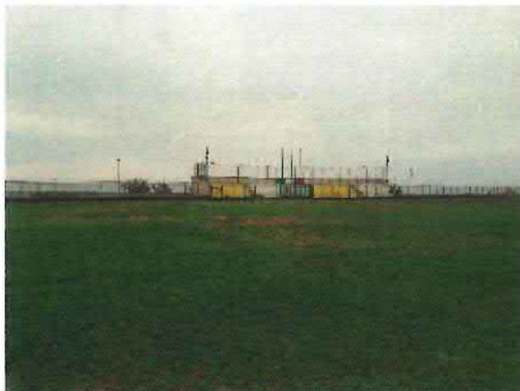
Lotto 1 – Campo da calcio

Su una parte rilevante del Lotto 2 è presente vegetazione ad alto fusto, costituita da Pini e Ulivi.