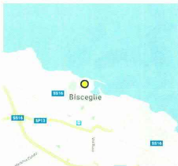
Figura 2.1: Ubicazione dell'immobile – inquadramento a scala provinciale

La Proprietà è localizzata su Via della Libertà 13, nella zona semiperiferica del Comune di Bisceglie, Essa è ubicata al confine di un ambito urbano omogeneo destinato ad edificio e spazi pubblici o privati di interesse generale, quale il Cimitero Comunale.