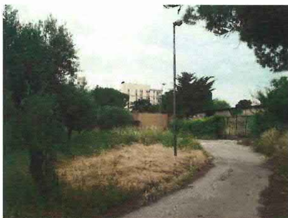
Lotto 2 – Aree a verde