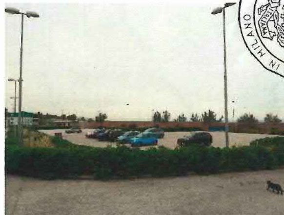
Lotto 1 – Parcheggio