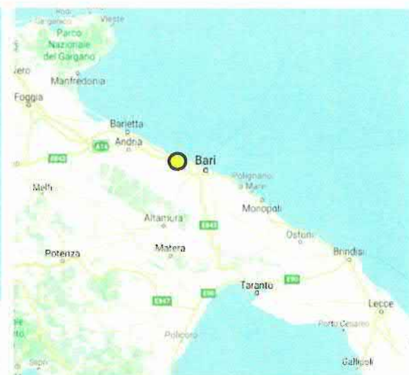
Figura 2.2: Ubicazione dell'immobile – inquadramento a scala regionale