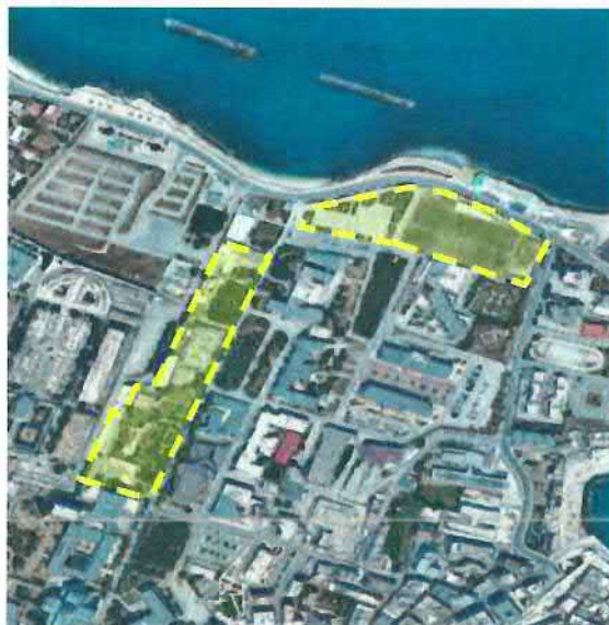
Figura 1.2: Comune di Bisceglie – Vista Aerea